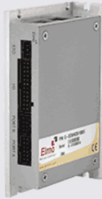
Gold DC Whistle